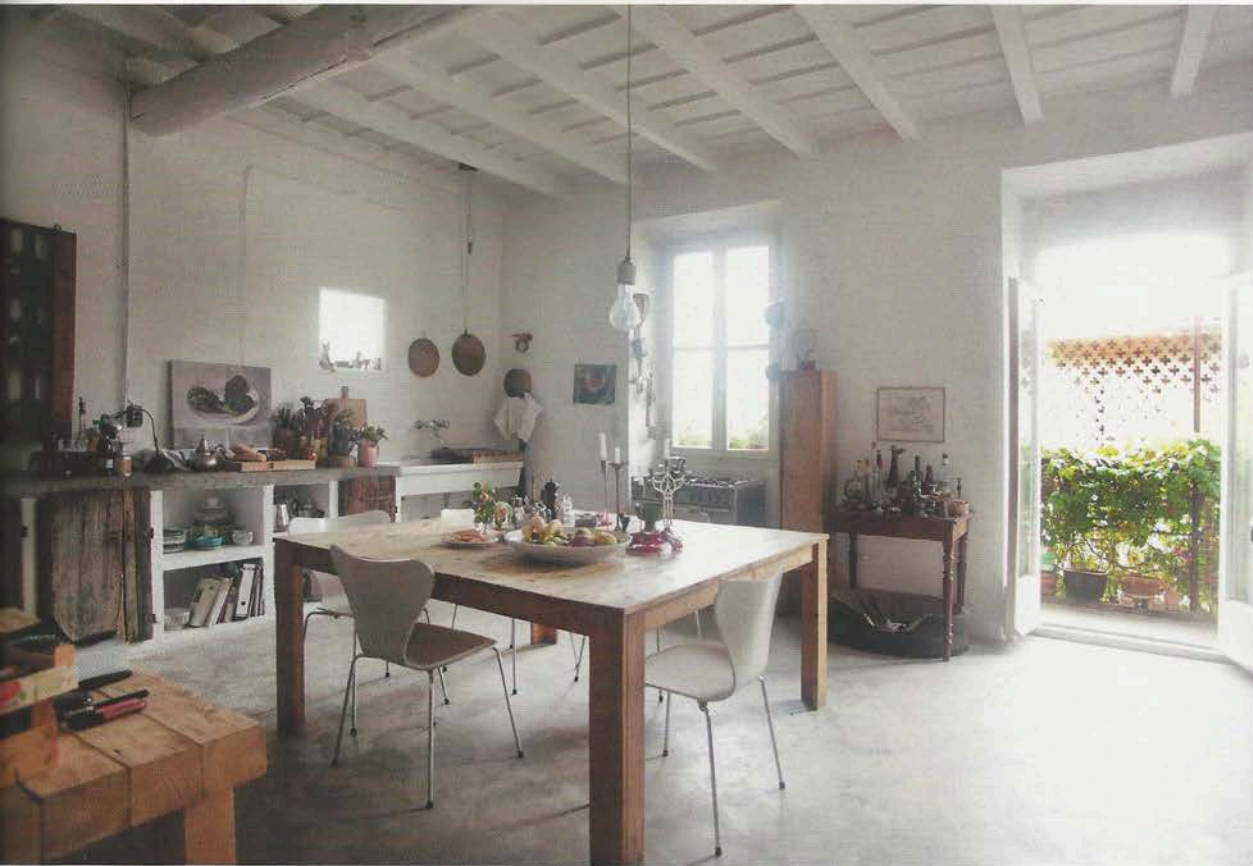
Dans la cuisine, la sobriété à l'état brut est le maître-mot, comme dans le reste de la maison.