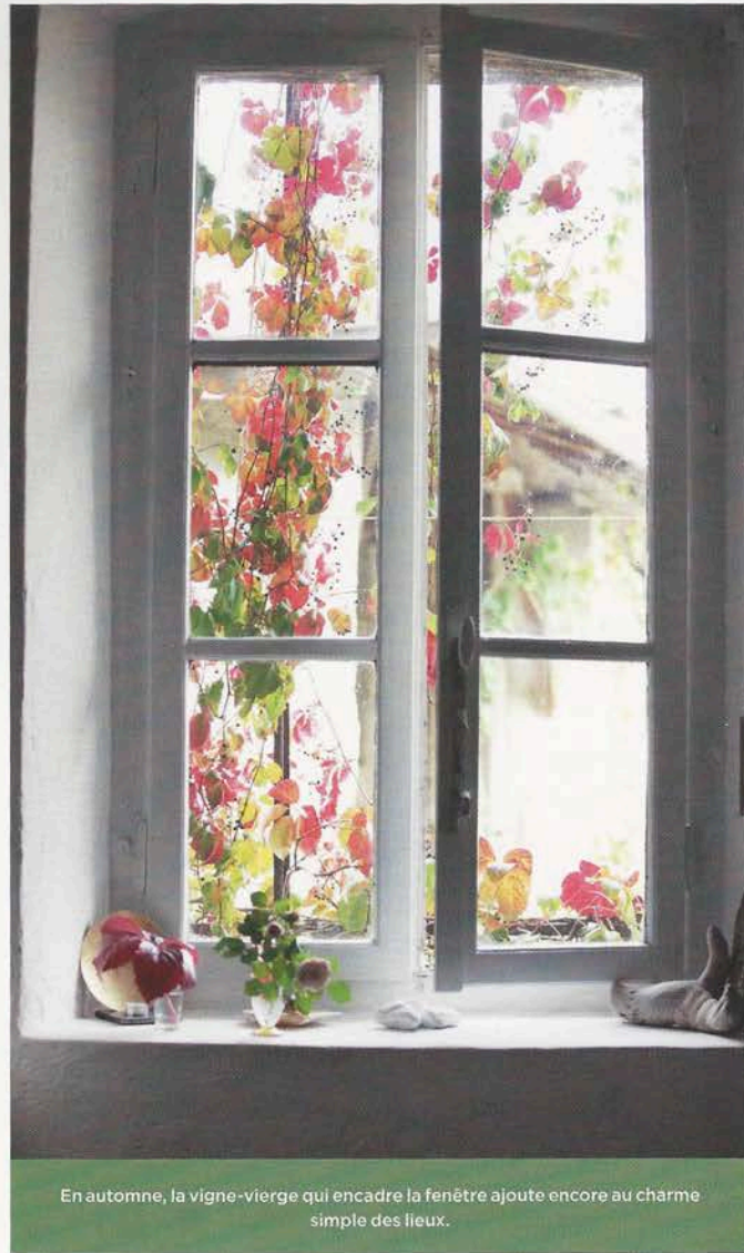
En automne, la vigne-vierge qui encadre la fenêtre ajoute encore au charme simple des lieux.